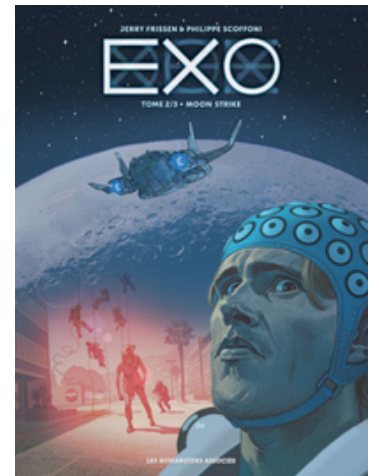
Exo (T2) Moon Strike

Ce tir a projeté sur Terre, dans le Colorado, cinq organismes intelligents qui ont immédiatement pris possession d'humains en venant parasiter leurs cerveaux. Un plan, implacable et menaçant pour l'humanité, se met en place impliquant le professeur Koenig et sa fille, les autorités américaines qui ont récupéré un des cinq, un schizophrène que l'entité a du mal à maîtriser et une mission militaire envoyée en urgence sur la Lune.