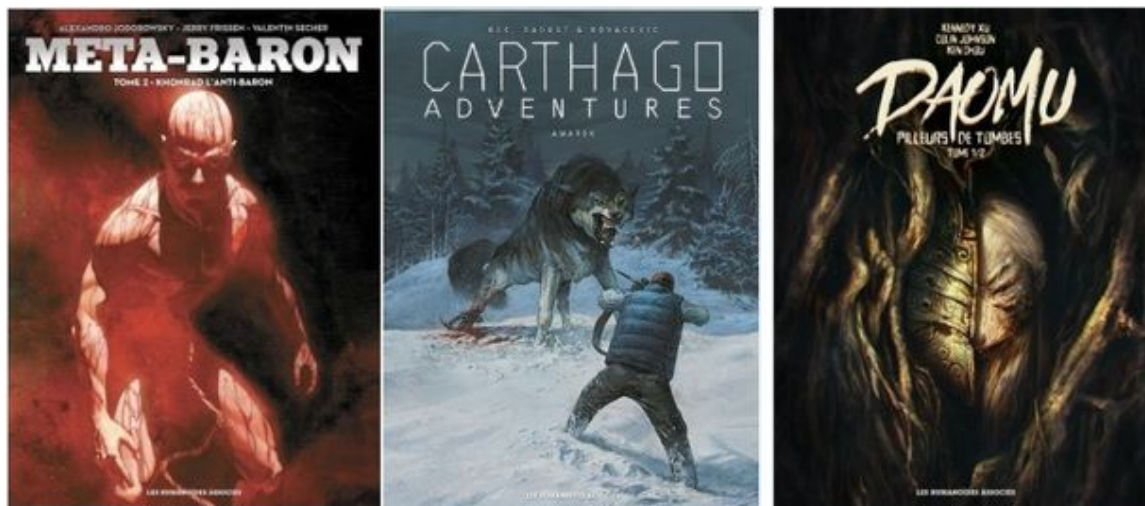
Les couvertures de 3 albums - ©Humanoïdes associés édition 2016.

Petite nouveauté dans la nouvelle série de Jerry Frissen, d'après l'univers de Jodorowsky, avec la présence marquée de sentiments : l'amour de Tétanus pour Eris et l'amour paternel qu'il porte à sa création. Si la cruauté et la violence sont toujours bien présentes dans cette série, on peut dire qu'elle s'enrichit donc d'un genre nouveau, avec ces sentiments beaucoup plus présents qu'à l'accoutumée, même si on se souvient encore de l'amour de Tête d'acier pour Dona Vicenta Gabriela dans la série principale.