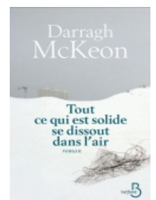
Tout ce qui est solide se dissout dans l'air : 26 avril 1986, Tchernobyl