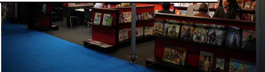
Le stand Glénat à Francfort