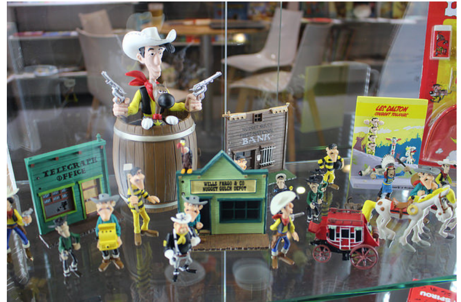
Les 70 ans de Lucky Luke sont aussi l'occasion de lui faire reprendre du poil de la bête sur certains marchés

Chez Glénat, le Japon et la Corée « sont en devenir », tandis que la Chine est en pleine émergence : « Il y a dix ans, les lecteurs chinois découvraient Tintin, et l'intérêt pour la bande dessinée adulte se concrétise aujourd'hui », note lui aussi Edmond Lee pour Les Humanoïdes. Forcément, « [l]es licences telles que les Minions (Dupuis) ou Angry Birds (Le Lombard) fonctionnent très bien en BD, mais nous avons aussi bon espoir dans la création, par exemple Violette , de Radice et Stefano Turconi, chez Dargaud, édité originellement en Italie par Tunue », souligne de son côté Sophie Castille, directrice des droits étrangers chez Mediatoon.