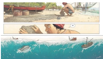
Carthago #4, la critique Dans "[Chroniques]"