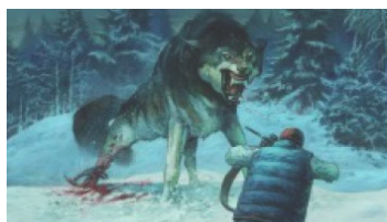
Carthago Adventures #4, la critique Dans "[Chroniques]"