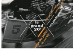
GRAU DU ROI Rencontre littéraire dans le cadre du « Printemps des poètes », ce samedi !