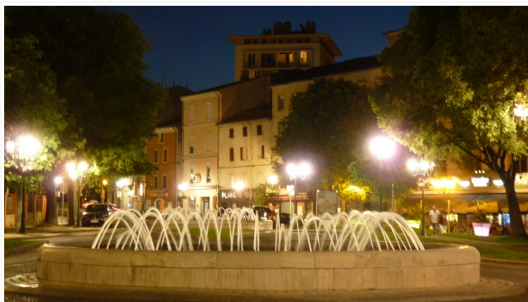
Boulevard Carnot, sur les bords du Gardon.