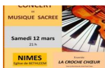
mars 11, 2016 NÎMES Concert de musique sacrée en l'église de Bethléem, ce