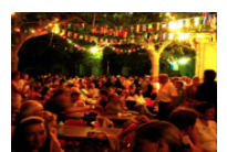
mars 11, 2016 PIÉMONT CÉVENOL Sorties et bons plans, du 11 au 13 mars 2016