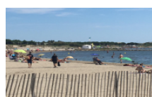
mars 11, 2016 GRAU DU ROI Sorties et bons plans, du 11 au 13 mars 2016