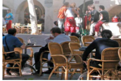
PAYS UZÈGE Sorties et bons plans, du 11 au 13 mars 2016 !