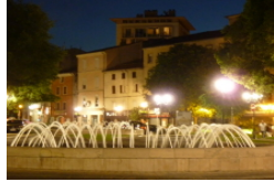
AUTOUR D'ALÈS Sorties et bons plans, du 11 au 13 mars 2016